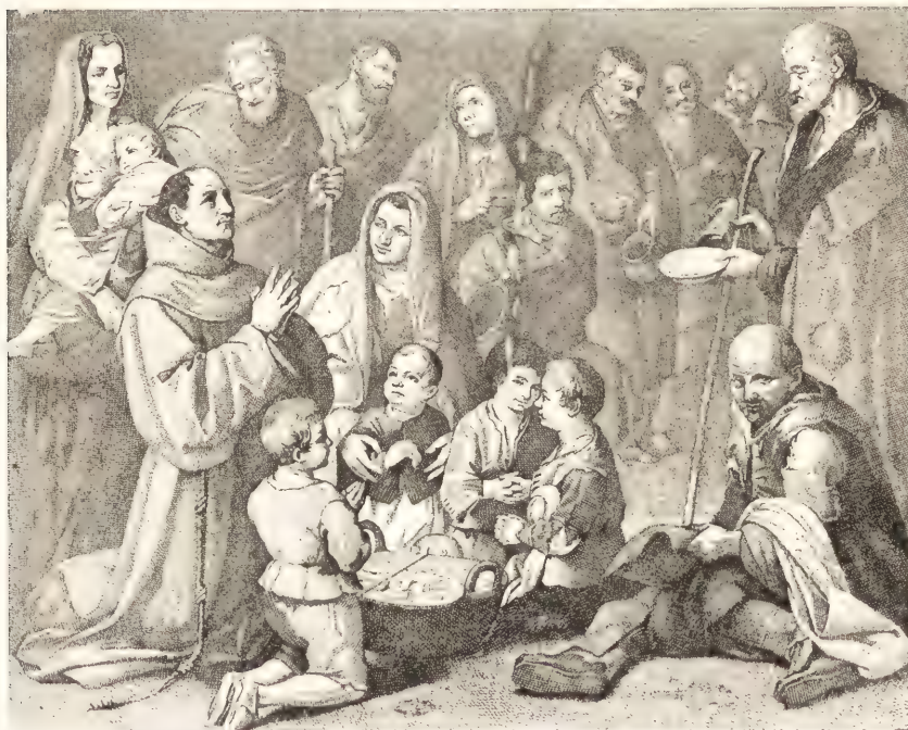
SAN DIEGO DE ALCALÁ AVEC LES PAUVRES.

dans les draperies, est plat partout ; le clair-obscur manque de profondeur ; enfin, les ombres, encore insuffisamment dégradées, font tache dans la toile, en enlevant toute justesse aux plans. Mais, à côté de ces tâtonnements et de tant d'imperfections, il est aussi des qualités qui se font puissamment jour.